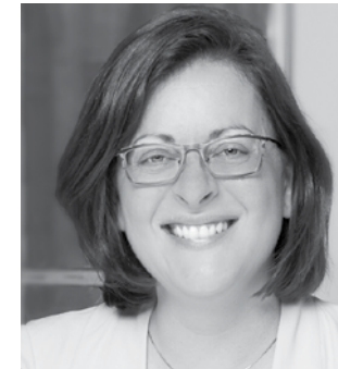
Maryse Couture Toiture Couture